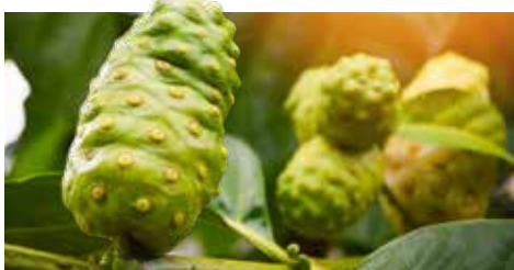
諾麗果+紅光發酵諾麗果